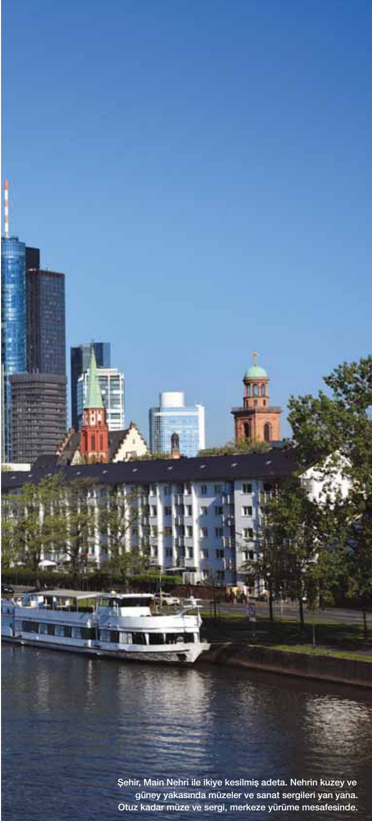
Şehir, Main Nehri ile ikiye kesilmiş adeta. Nehrin kuzey ve güney yakasında müzeler ve sanat sergileri yan yana. Otuz kadar müze ve sergi, merkeze yürüme mesafesinde.

● Gökyüzünü delen binaların gölgesindeki, tarihi özelliklere sahip ahşap evleri, II. Dünya Savaşı'ndan kalma acı anıları hatırlatan binaları, taban tabana zıt özellikte semtleri, kalabalık fuarları, cıvılcı festivalleri, kültür-sanat etkinliklerini, finans kuruluşlarını ve yılın 365 günü birçok ülkeden gelen insanları harmanlayan bir şehir Frankfurt. Burada yaşayan üç kişiden sadece biri Alman. Bir yılda 3 milyon kişi geliyor bu fuarlar, festivaller ve kültür-sanat şehrine.