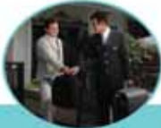
Size özel portör