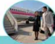
VIP araçla uçağa transfer