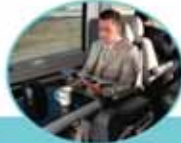
2007 model Mercedes Viano ile transfer